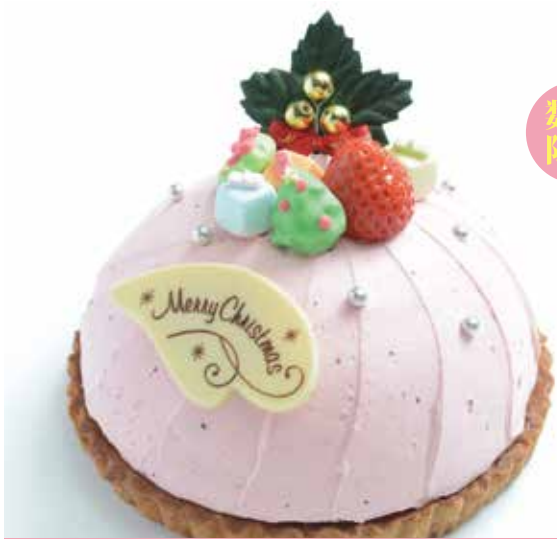
タルトレット・ローズ 直径 16cm 3,400円

さっくり手作りタルトのケーキ。 さっぱりした苺のムース&クリームでデコレーション。